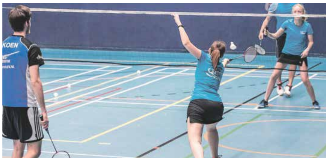
Le badminton, un sport pour tous que l'on pourra découvrir et pratiquer à trois reprises dans le cadre de CormoBouge

Dès le 1 er mai, comptabilisez des minutes de mouvement pour le Duel intercommunal et pour votre santé