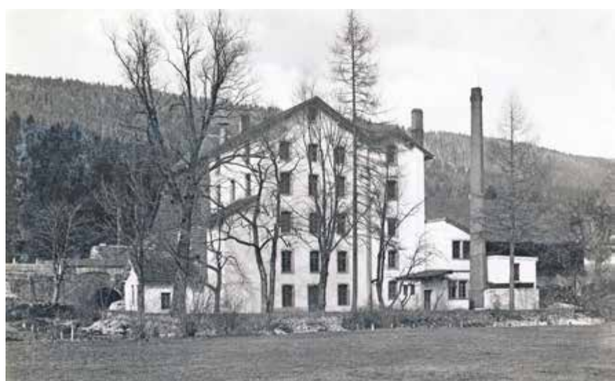
Usine de produits alimentaires du Torrent à Cormoret, vers 1930

Un moulin est déjà signalé en 1437 sur les sources de la Doux. Au fil des siècles et de l'eau, le bâtiment subit plusieurs modifications et voit passer de nombreux meuniers.